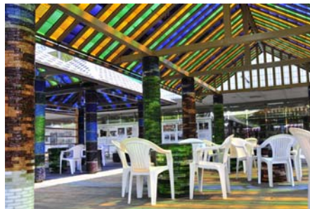
クリスタルパララー