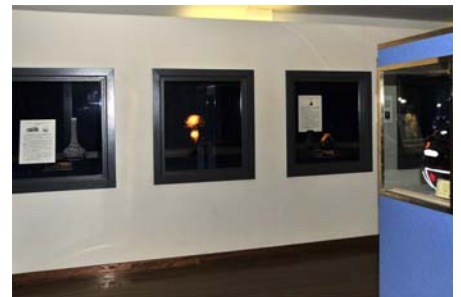
ガラスアート 美術館