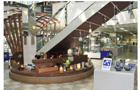
クリスタルギャラリー