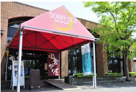
地ビール&レストラン ドブリーデン